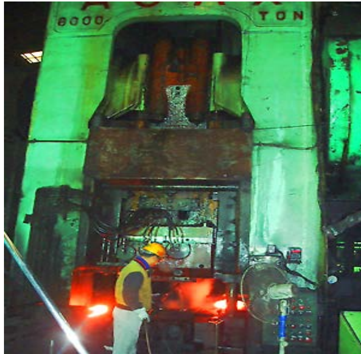
پرس مکانیکی آهنگری