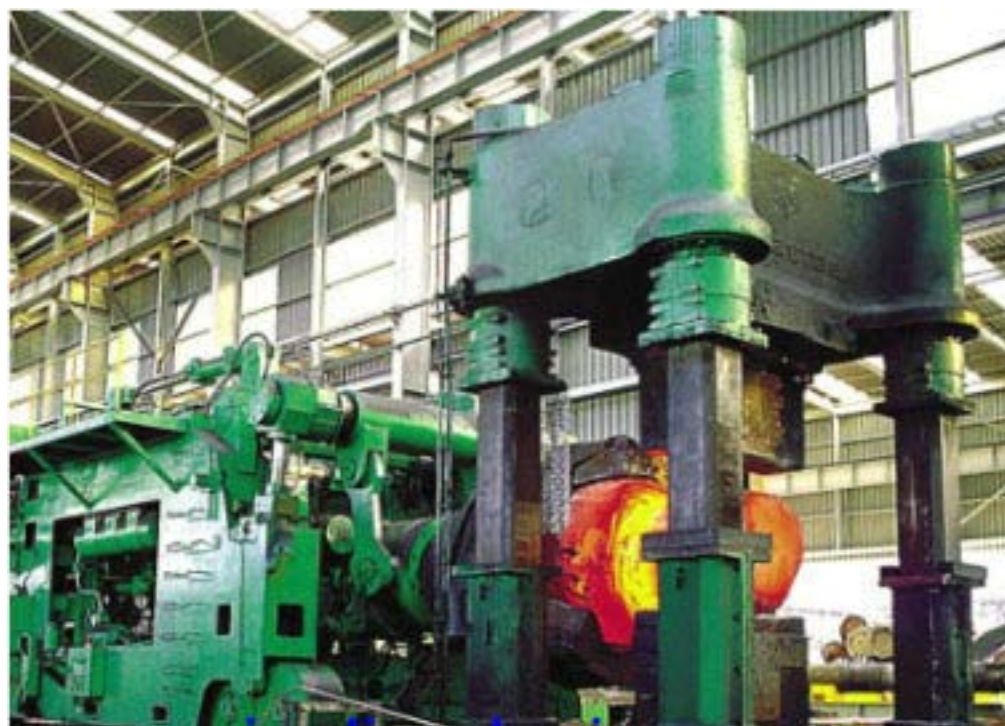
پرس هيدروليک آهنگري و ماني پولاتور ريل دار