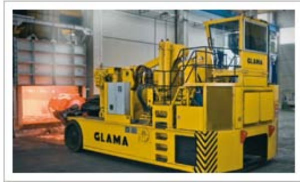
ماني پولاتور چرخ دار