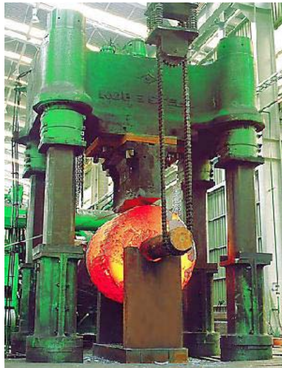
پرس هیدرولیکی آهنگری