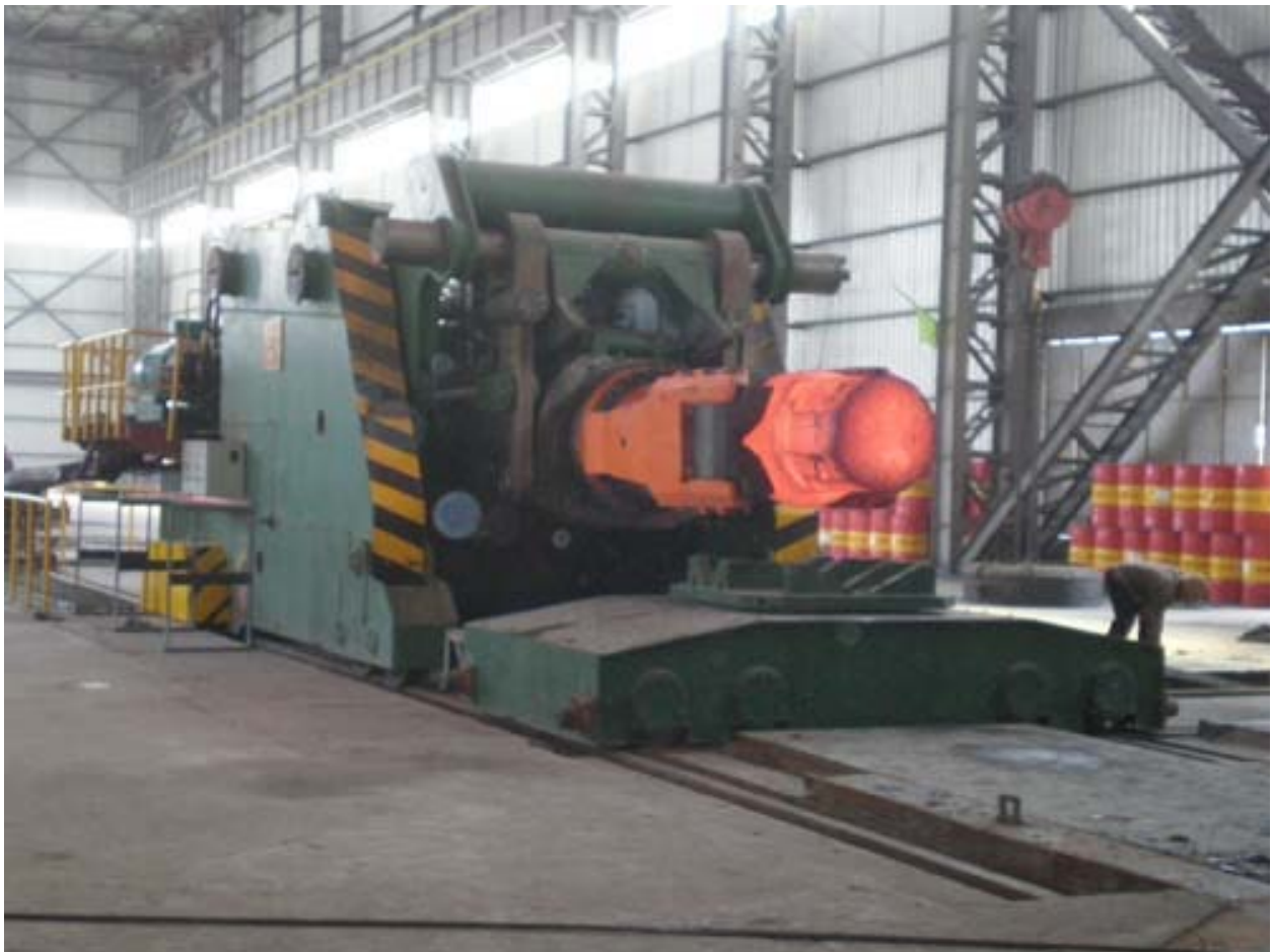
ماني پولاتور ریل دار